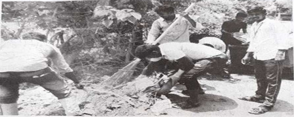
மேலமணக்குடி கிராமத்தில் தூய்மைப் பணியில் ஈடுபட்ட கடலூர் பெரியார் அரசு கலைக் கல்லூரி மாணவர்கள்.

கடலூர், ஜூலை 6: கடலூர் அரசுக் கல்லூரி மாணவர்கள் கிராமங்களில் தூய்மைப் பணியில் ஈடுபட்டு வருகின்றனர்.